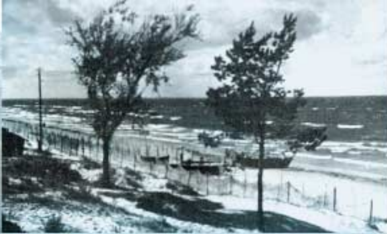
Tiklu žāvēšana Kolkas jūrmalā 50-tos gados

Sievietes zvejā nepiedalījās, bet veica galvenos darbus lomu apstrādē un pārdošanā. Ritos viņas valgumā gaidīja virus atgriežamies no jūras un ķērās pie zivju apstrādes: purgāja zivis no tikliem, palīdzēja vīriem nogādāt tās mājās, kur zivis mazgāja, tīrīja, vēra uz virbiem , kūpināja, pepināja (sk. tālāk) un citādi apstrādāja.