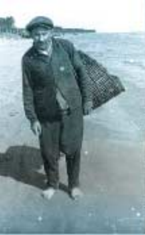
Zvejnieks nes lomu mājās