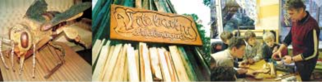
Bite Laumu dabas parkā