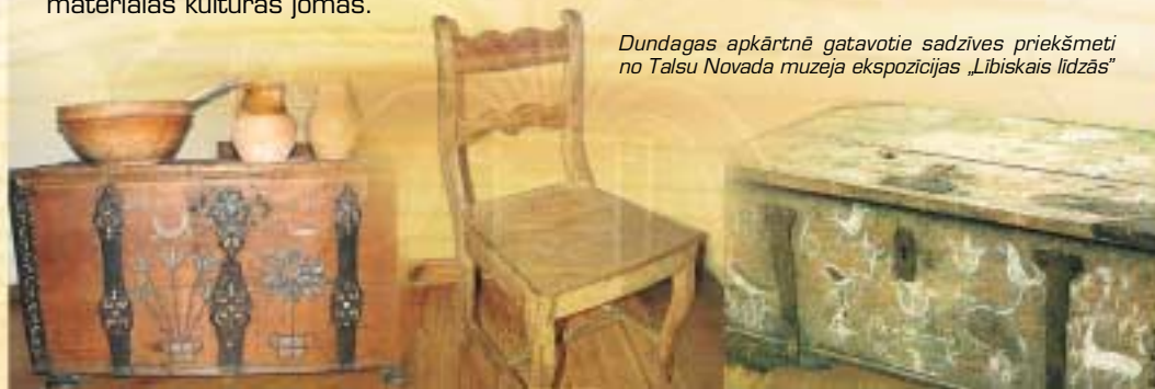
Dundagas apkārtņē gatavotie sadzīves priekšmeti no Talsu Novada muzeja ekspozīcijas „Lībiskais līdzās”

20. gs. līdz 1940. g. gandrīz katrā lielākā Dundagas apkārtnes ciemā ir savs kokamatnieks – galdnieks. Lībiešu ciemos ienāk arī latviešu izcelsmes amatnieki. Vēsturiski ciešie kontakti veicina lībiešu un latviešu savstarpējos aizguvumus visās sadzīves un materiālās kultūras jomās.