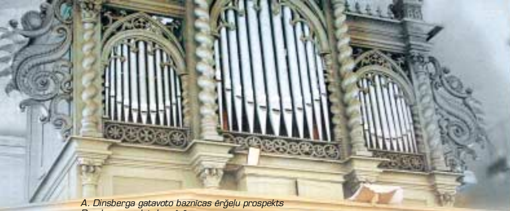
A. Dinsberga gatavoto baznīcas ērģeļu prospekts Dundagas ev. lut. baznīcā